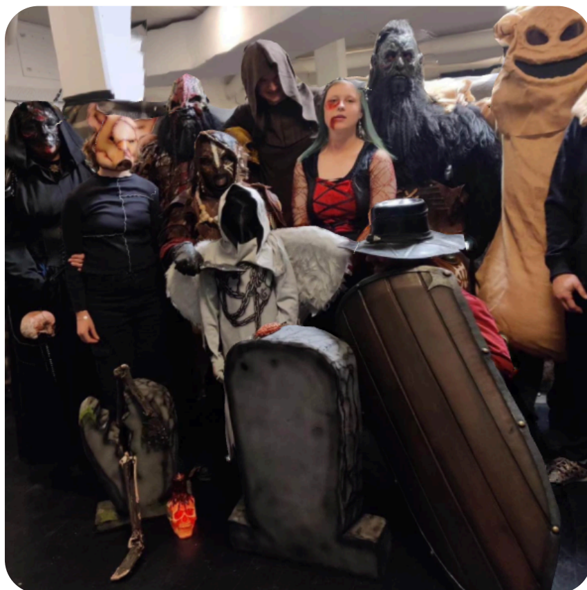
Rollespillerne i deres flotte og uhyggelige kostumer

Sidste års halloween-arrangement var en bragende succes, og vi gentog derfor det gode samarbejde med Foreningen Nordsjællands Rollespillere om at afholde et uhyggeligt halloween på biblioteket. Vi bød på kreaværksted, hvor man kunne hygge sig med at lave en lanterne. Rollespillerne havde medbragt sværd og masker, som man kunne prøve. Og så var der en meget populær skattejagt i bibliotekets kælder, der i dagens anledning var gjort uhyggelig, og hvor rollespillerne huserede i deres vilde udklædninger. Hele huset var fyldt med omkring 300 børn og voksne, som syntes, at det var en fantastisk gyselig oplevelse.