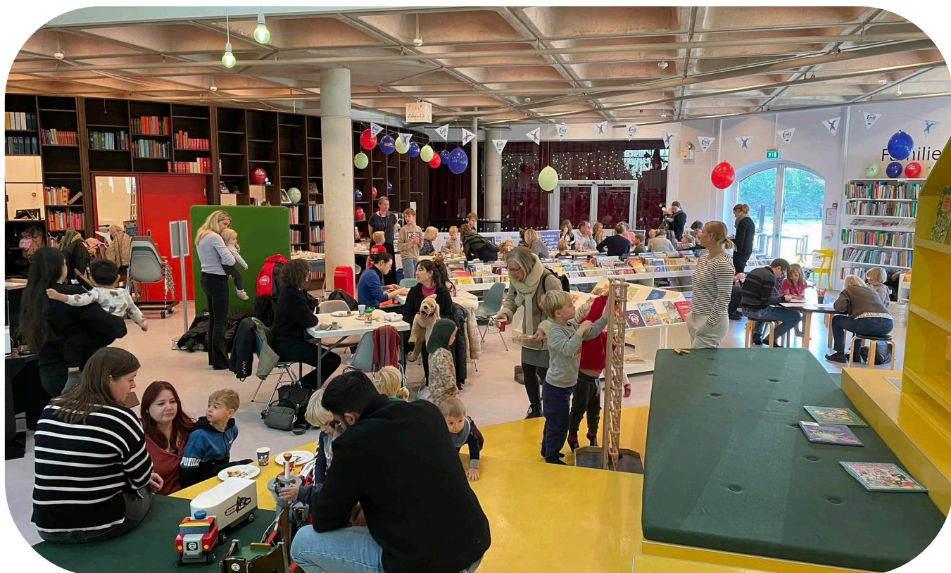
Fødselsdagsfest for Emil fra Lønneberg

I uge 46 deltog biblioteket i Nordisk Litteraturuge, hvor de deltagende institutioner fra hele Norden arrangerer højtlesning af det samme tekstuddrag. I år var børnebogs-uddraget fra Emil fra Lønneberg, og da det i 2023 var 60 år siden, at Astrid Lindgren skrev den første bog om Emil, syntes vi, at det skulle fejres med manér. Vi fik stabledet et fint lørdagsarrangement på benene med udstilling og pynt, quiz, saft og kage samt kreaborde, hvor børnene kunne tegne og snitte træfigurer. Det blev en rigtig hyggelig fødselsdagsfest for Emil med mere end 130 glade deltagere. Desuden inviterede vi skoleelever fra de mindste klasser til en særlig slags højtlesning kaldet sanselæsning, hvor flere af børnenes sanser aktiveres, så historien bliver gjort endnu mere levende.