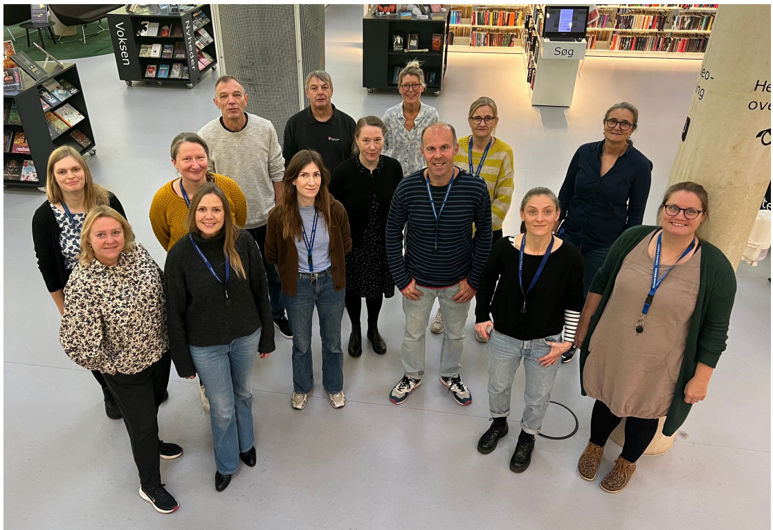
Personalet på Hørsholm Bibliotek

Vi glæder os til at se jer på Hørsholm Bibliotek i 2024!