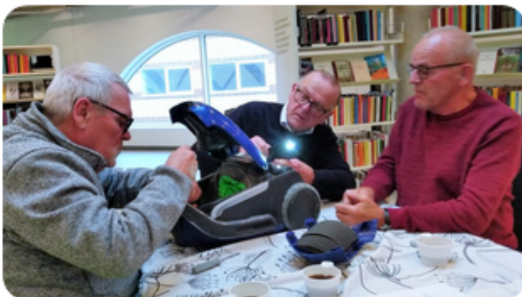
De frivillige ved Repair Café ordner en støvsuger, så den virker igen

I november afholdt biblioteket den første Byttedag med stort engagement fra en gruppe frivillige borgere som hjalp til på dagen. På Byttedagen kunne borgere indlevere brugt tøj og sko og til gengæld tage noget nyt (brugt) med hjem. Dette arrangement understøtter målet om øget bæredygtighed (både ift. økonomi, natur og miljø) og samtidig styrkes borgerinddragende aktiviteter i kulturhuset. Dagen var på flere planer en stor succes og vil blive gentaget.