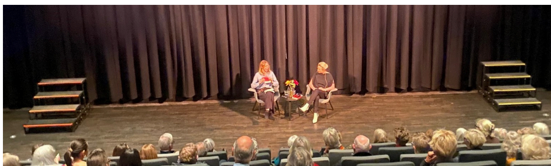
Smørrebrødsrejse med Helle Helle i Stortrommen

Løbende arbejder biblioteket med at udvikle arrangementsformaterne, så biblioteksbrugeren oplever et levende og alsidigt bibliotek, som følger med udviklingen og tiden. I 2023 afholdt biblioteket bl.a. det succesfulde, udsolgte forfatterarrangement Smørrebrødsrejse med Helle Helle – arrangeret som forfatterinterview med efterfølgende fællesspisning med forfatterdeltagelse, hvor publikum spiste samme frokostenretninger som hovedkarakteren i Helle Helles seneste roman 'Hafni fortæller' - på denne måde blev litteraturen konkretiseret og foldet ud i det fysiske rum og et fællesskab omkring litteraturen gennem fællesspisningen udfoldede sig.